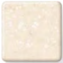
ABALONE (3) \frac{1}{2} in 12.3 mm