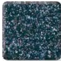
OCEANIC (2) \frac{1}{4} \frac{1}{2} in 6 12.3 mm