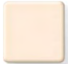
PEACH (1) \frac{1}{4} \frac{1}{2} in 6 12.3 mm