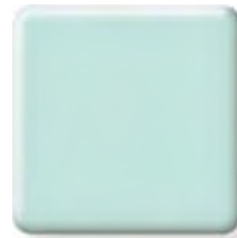
MINT ICE NEW (1) \frac{1}{4} \frac{1}{2} in 6 12.3 mm