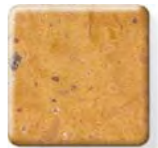
** AZTEC GOLD NEW