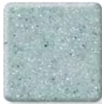
AQUA (2) \frac{1}{4} \frac{1}{2} in 6 12.3 mm