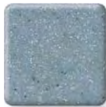
STONE WASHED (2) \frac{1}{2} in 12.3 mm