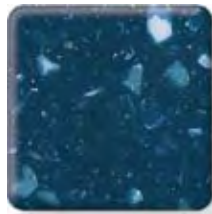
ATLANTIS (4) \frac{1}{2} in 12.3 mm