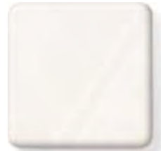
** VENARO WHITE

(1) \frac{1}{6} \frac{1}{2} in 6 12.3 mm