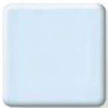
BLUEBERRY ICE NEW (1) \frac{1}{4} \frac{1}{2} in 6 12.3 mm