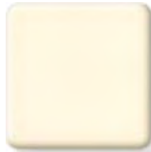
VANILLA (1) \frac{1}{4} \frac{1}{2} in 6 12.3 mm