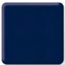
MARINE BLUE * (2) \frac{1}{2} in 12.3 mm