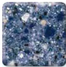
MEDITERRANEAN (4) \frac{1}{2} in 12.3 mm