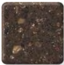
COCOA BROWN *