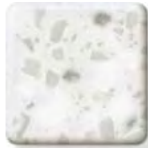
SILVER BIRCH NEW

(1) \frac{1}{4} \frac{1}{2} in 6 12.3 mm