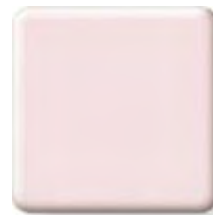
STRAWBERRY ICE NEW

(2) \frac{1}{4} \frac{1}{2} in 6 12.3 mm