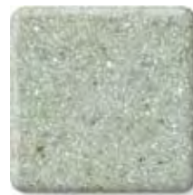
TARRAGON (2) \frac{1}{2} in 12.3 mm