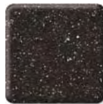
SHALE * (2) \frac{1}{2} in 12.3 mm