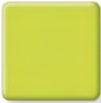
GRAPE GREEN *