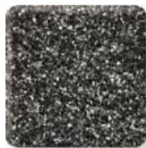
MIDNIGHT (2) \frac{1}{4} \frac{1}{2} in 6 12.3 mm