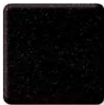
EBONY BLACK *

(3) \frac{1}{4} \frac{1}{2} in 6 12.3 mm