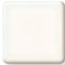
GLACIER ICE NEW

(1) \frac{1}{6} \frac{1}{4} \frac{1}{2} \frac{3}{4} in 4 6 12.3 19 mm