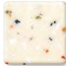
FESTIVAL (3) \frac{1}{2} in 12.3 mm