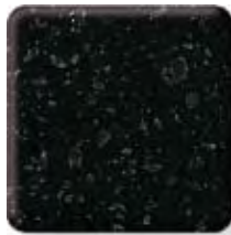
NIGHT SKY *