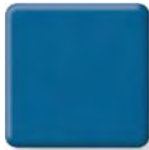
GRAPHIC BLUE * (2) \frac{1}{2} in 12.3 mm