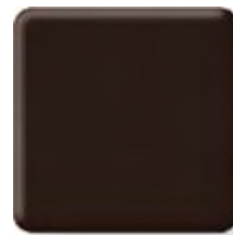
COFFEE BEAN *