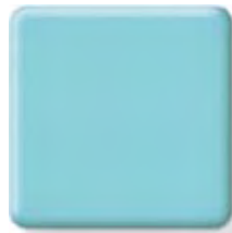
SUMMER SKY * (2) \frac{1}{2} in 12.3 mm