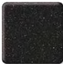
BLACKBERRY ICE *