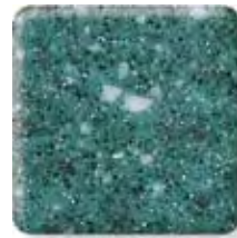
SPRUCE (3) \frac{1}{2} in 12.3 mm