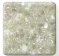
CARIBBEAN (4) \frac{1}{2} in 12.3 mm