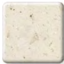
** CLAM SHELL NEW

(1) \frac{1}{4} \frac{1}{2} in 6 12.3 mm