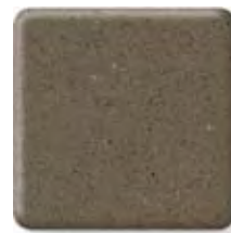
SIENNA BROWN *