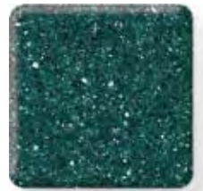
MALACHITE (2) \frac{1}{4} \frac{1}{2} in 6 12.3 mm