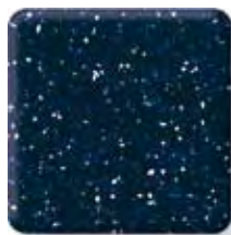
COBALT * (3) \frac{1}{2} in 12.3 mm