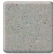
DOVE (2) \frac{1}{2} in 12.3 mm