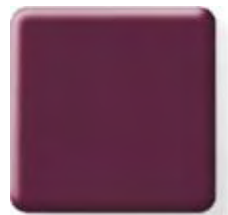
CLARET NEW *