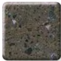
** LAVA ROCK NEW