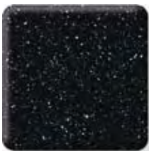
BLACK QUARTZ *

(2) \frac{1}{4} \frac{1}{2} in 6 12.3 mm