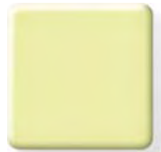
LIME ICE NEW (1) \frac{1}{4} \frac{1}{2} in 6 12.3 mm