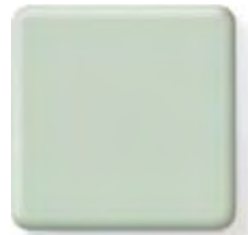
SEAGRASS (1) \frac{1}{4} \frac{1}{2} in 6 12.3 mm