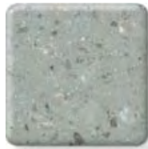
BLUE PEBBLE (4) \frac{1}{2} in 12.3 mm