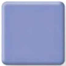
LILAC * (2) \frac{1}{2} in 12.3 mm