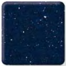
AZURE * (3) \frac{1}{2} in 12.3 mm