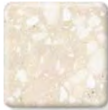
SAVANNAH (4) \frac{1}{2} in 12.3 mm