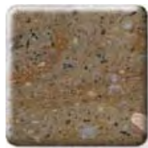
** SONORA NEW