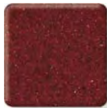
POMPEII RED *