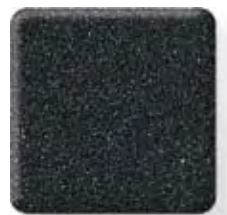
ANTHRACITE * (3) \frac{1}{2} in 12.3 mm

* Plus que les tons clairs et texturés, les couleurs sombres et fortement pigmentées trahissent les éraflures, la poussière et les traces d'usure ordinaire. Nous vous recommandons de ne pas utiliser ces couleurs pour les applications où la surface est exposée à un usage intensif et à une multiplication des contacts (pour les plans de travail par exemple), mais de les réserver pour celles où les contacts sont relativement légers ou pour créer des incrustations et des touches colorées. Pour plus d'informations sur la manière de sélectionner la couleur Corian® idéale pour votre application, veuillez contacter votre représentant DuPont™ Corian®.